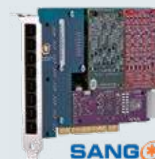
SANGOMA כרטיסי ממשק דיגיטליים ואנאלוגיים