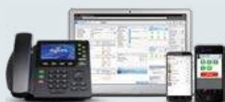
SANGOMA SWITCHVOX BUSINESS VOICE SYSTEMS