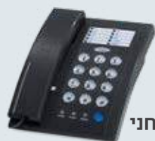
inova טלפון שולחני דגם: 8510