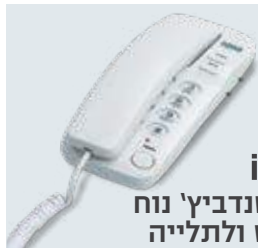
inova טלפון סנדביץ' נוח לשימוש ולתלייה דגם: S1000