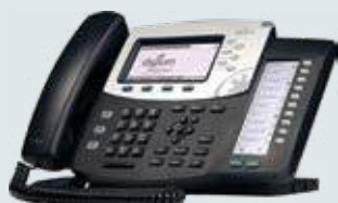
SANGOMA טלפוני IP

SANGOMA היא ספקית מובילה של רכיבי חומרה ותוכנה המאפשרים או משפרים את מערכות תקשורת IP עבור יישומי טלקום ו-DATACOM. לוחות הקול, השערים ותוכנת הקישוריות משמשים במרכזי, IVR, PBX מרכז קשר ויישומי תקשורת נתונים ברחבי העולם. DIGIUM מבית SANGOMA היא מפתחת ASTERISK, הקוד הפתוח הנפוץ ביותר לשימוש לפיתוח תוכנות בתחום הטלפוניה.