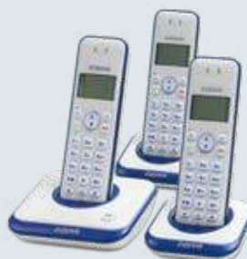
inova טלפון אלחוטי דיגיטלי עם 3-1 שלוחות דגם: AG1000 יחיד/ AG2000 זוגי/ AG3000 שלישייה